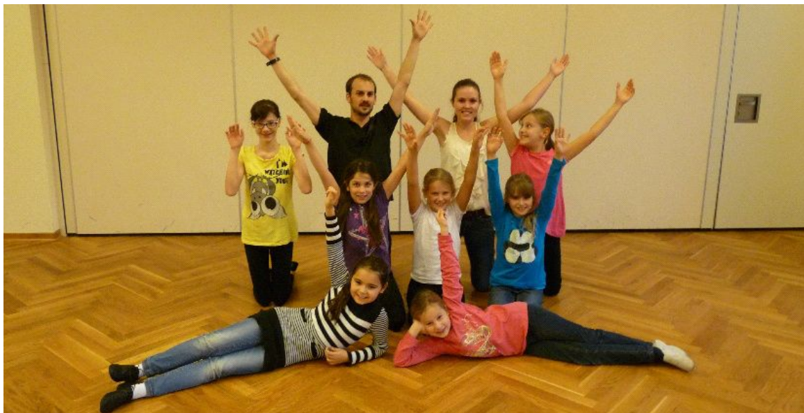
Die erfolgreichen Tanzkinder