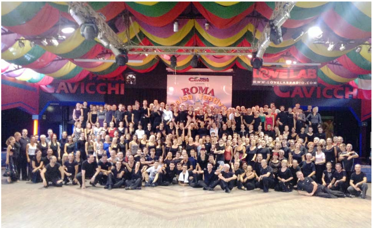
Fototermin mit Trainern und Schülern

Sonntag Morgen: Wir wollen uns an einen der langen Frühstückstische setzen und ein junger Schnösel bemerkt: „This is just for dancers!“ Mein strenger Blick lässt ihn verstummen. Der zweite Tag läuft dann trainingsmäßig ähnlich wie der erste. Lecture, Workshops und zweimal Competition Training für die Ausdauer. Heute werden die Heats nach Alter eingeteilt. Die (wenigen) Senioren tanzen mit den über 18-Jährigen. Die U18 sind heute so stark vertreten, dass sie eine eigene Heat bilden. Der Schnösel hat Glück.