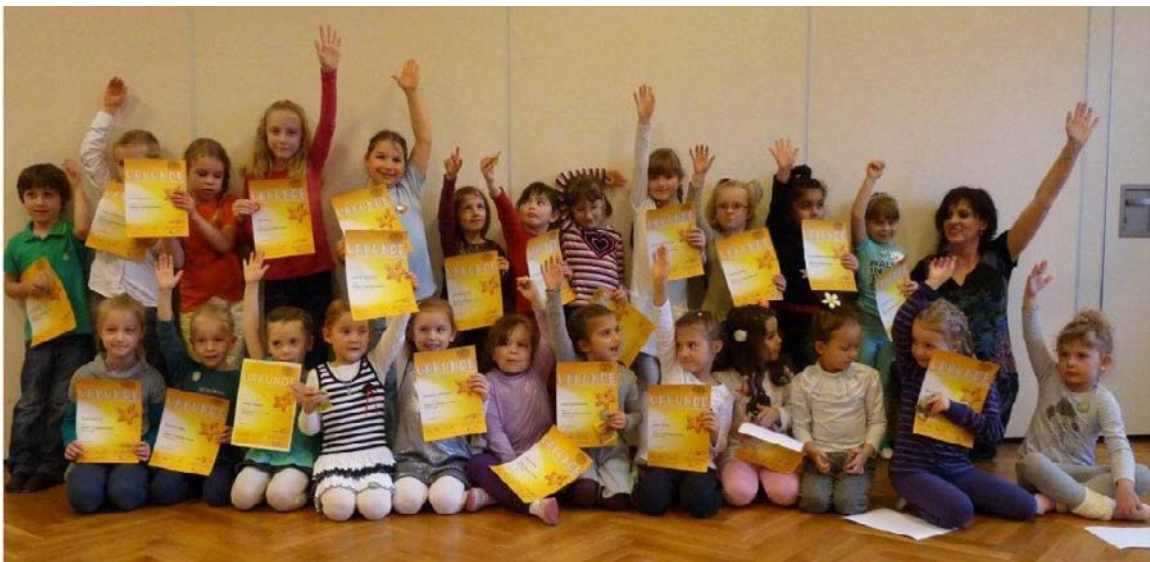
Die erfolgreichen Tanzmäuse

Den Kleinsten ab knapp 5 Jahren wurden die Urkunde und der Tanzsternenbutton des Deutschen Tanzsportverbandes gleich vor Ort ausgehändigt.