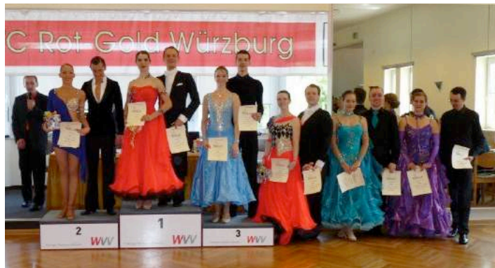
Siegerehrung Hgr B