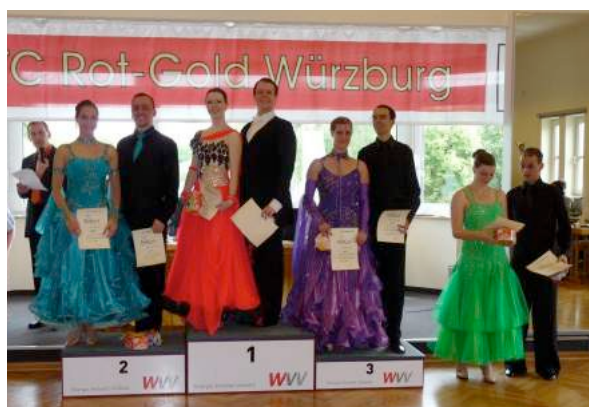
Siegerehrung Hgr II B