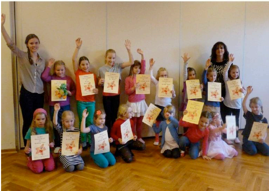
Die erfolgreichen Tanzsternen

Den Kleinsten ab knapp 5 Jahren wurden die Urkunde und der Tanzsternenbutton des Deutschen Tanzsportverbandes gleich vor Ort ausgehändigt.