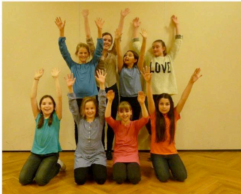
Die erfolgreiche Freitagsgruppe