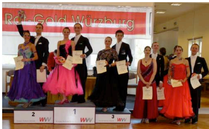
Siegerehrung Hgr A