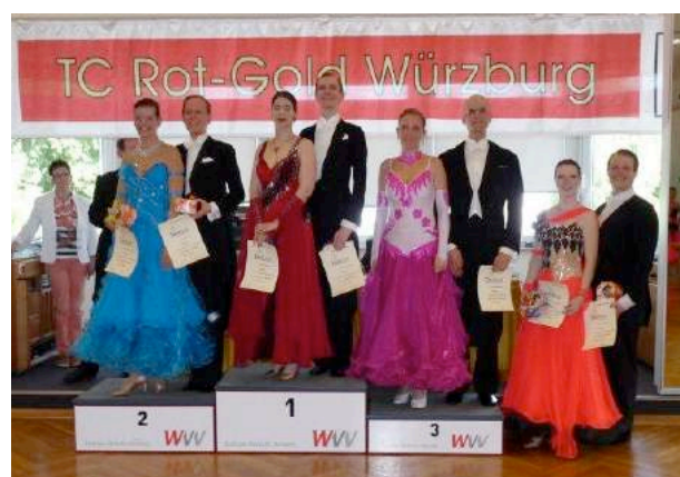
Siegerehrung Hgr II A